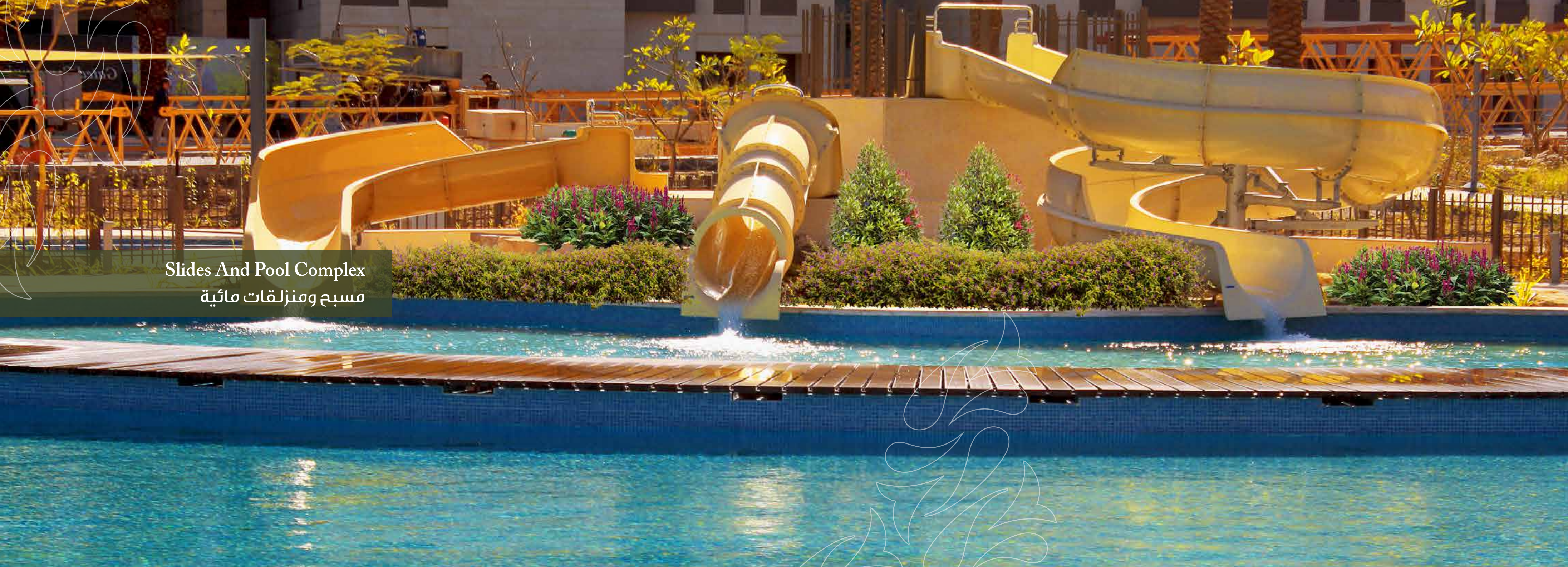
Slides And Pool Complex مسبح ومنزلقات مائية